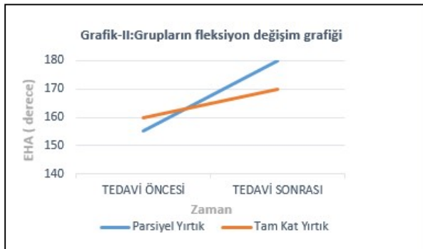
Grafik II: Gruplar arası fleksiyon EHA ölçümünün değişim grafiği

VAS: Vizüel Analog Skala TÖ: Tedavi öncesi TS: Tedavi sonrası. Veriler ortanca (25. Ve 75. yüzdeler) olarak ifade edilmiştir. p*: Grup içi karşılaştırma için Wilcoxon signed rank testi sonuçlarını gösterir. p**: Gruplar arası karşılaştırma için Mann-Whitney U testi sonuçlarını gösterir