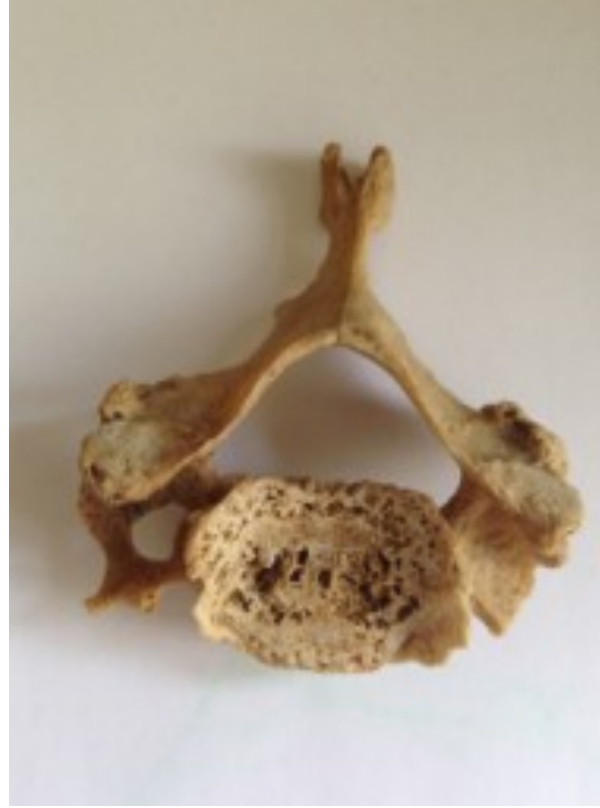
Şekil I: Kapalı sol FT

Bu çalışmada 59 vertebrae cervicales'de bilateral FT gözlenirken bir tanesinde ise sol FT kapalı olup sadece sağ FT'si vardı (Şekil 1).