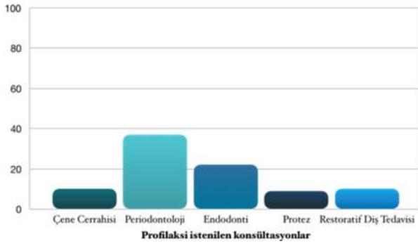
Şekil III: Profilaksi istenen romatoloji konsültasyonlarının dağılım yüzdesi

Ülser, viral hepatit, karaciğer hastalıkları gibi gastrointestinal sistem hastalıkları; astım, KOAH gibi solunum sistemi hastalıkları ve panik atak gibi diğer hastalıkların da tüm konsültasyonların %15'ini oluşturduğu, yine diğer hastalıklar için konsültasyonların en çok %48 oranla Ağız, Diş ve Çene Cerrahisi Anabilim Dalından geldiği tespit edildi.